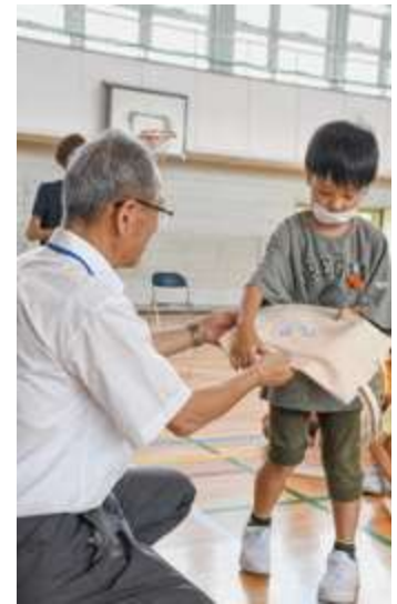
しっかりと本を受け取る児童（長崎小）