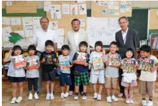
たくさん本を読んでください（豊田小）