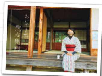
ホームページでは季節ごとの写真も掲載されていますので、ぜひ覗いてみてください

●協力隊への問い合わせ先● メール：nakayamanonaka@gmail.com 事務所：中央公民館2階