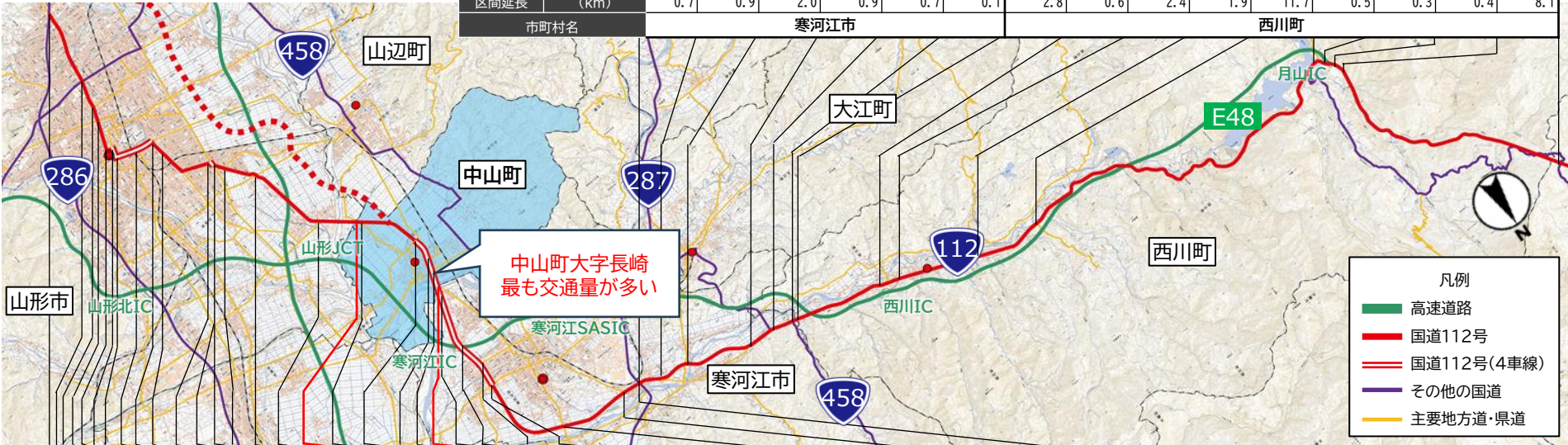
※国土地理院地図を加工して作成