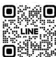
友だち登録はこちら

※別日の相談やご自宅への訪問も可能です。ご希望される場合はお問い合わせください。