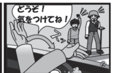
②運転者は、必ず止まって横断をうながそう