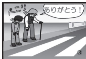
③横断者は、感謝の気持ちを伝えよう