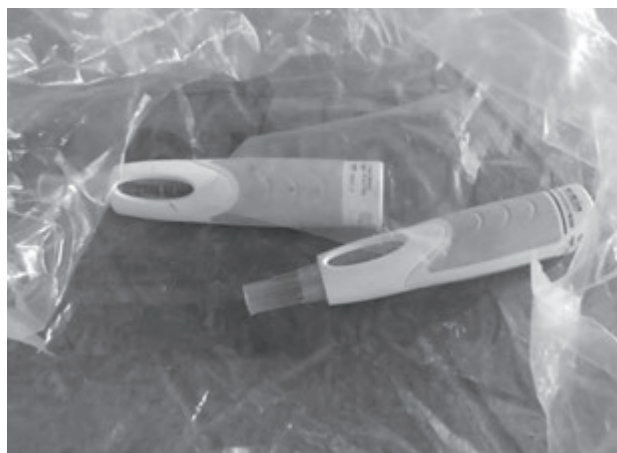
インスリン注射器