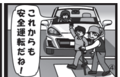
④「交通安全ありがとう運動」推進中