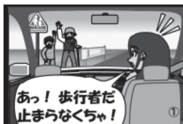
①横断者は、横断の意思を伝えよう