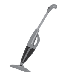
コードレス掃除機

充電式電池が内蔵されている下記の充電式電子機器は水銀含有ごみ（無料）として、透明袋に入れて出してください（ 雑貨品・小型廃家電類の袋には、絶対に入れないでください ）。