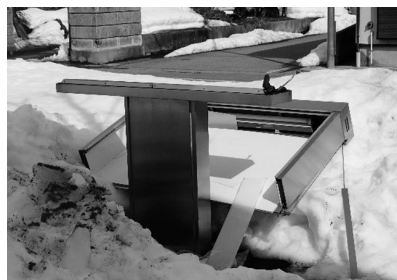
強風で倒壊した看板