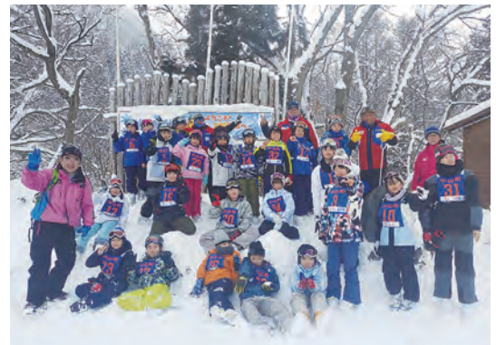
冬の素敵な思い出になったようです

最終日にはジュニアバジテストが行われ、練習の成果を発揮し、スキーを満喫しました。