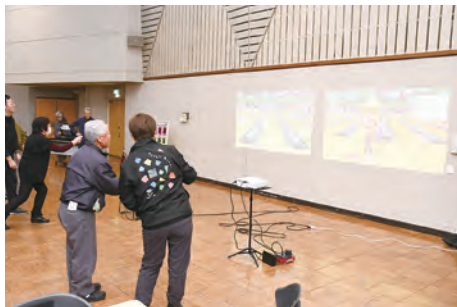
eスポーツを楽しむ参加者