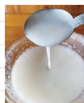
『のむおめ』の試作品