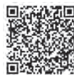
詳細はこちらから

参加した子どもたちは、プログラミングツール「Scratch」を使って、「令和7年は、昭和100年である。〇か×」などのクイズをつくり、「自分でプログラミングして、クイズをつくるのが楽しかった」と話していました。