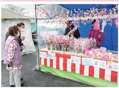
団子木を買い求める人も