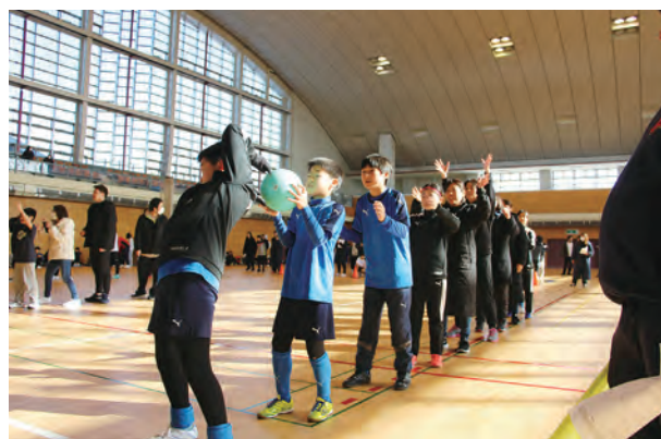
仲間とボールを繋ぐ「ボールリレー」