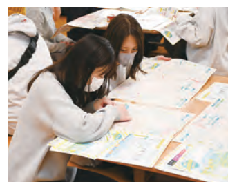
自宅の位置を確認する参加者

「my減災マップ」はハザードマップのように洪水災害や土砂災害で被害に遭いやすい箇所が色付けされている地図で、参加者は自分の家を確認し、最寄りの避難場所を確認したり、災害に合わせて集合場所を考えたりして身を守る方法を考え、自分だけの減災マップを完成させました。