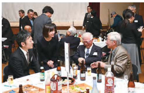
会話がはずむ参加者たち