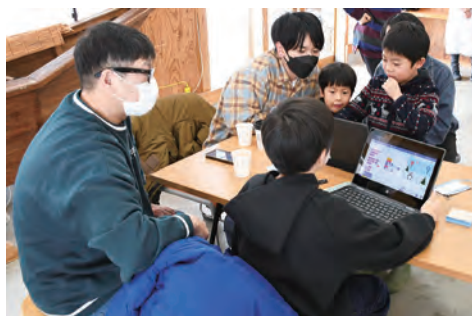
パソコンでプログラミングする子どもたち

1月24日、旧情報・物産館まるっとで、子ども向けデジタル体験型ワークショップ「プログラミングで〇×クイズをつくろう」を開催しました。