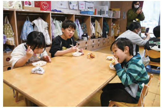
「納豆餅が一番好き！」と話してくれました

石沢会長は「杵と臼について食べるという習慣はほとんど無くなってしまった。今回は見て、ついて、食べるという貴重な経験ができたのではないと思う。この伝統文化を後世に残していきたい」と話していました。