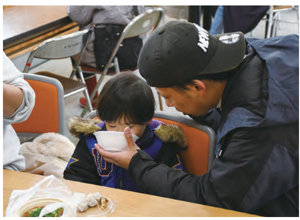
美味しそうに芋煮を味わう親子

初市は江戸時代から続く伝統行事で、町では最上川舟運によって上方や酒田方面から届いた塩や呉服、瀬戸物（陶器）などたくさんの店がたち並び商取引でにぎわいました。近年は役場前の上町通りからゆ・ら・ら前に場所を移して開催しており、訪れた人は立ち並ぶ屋台で買い物をしたり、北前いも煮の振舞いを楽しんでいました。