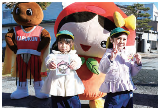
かわいいイラスト入りの年賀状を見せてくれた園児たち

12月19日には羽前長崎駅前ではセレモニーが行われ、かぶくんとしずくちゃんが見守る中、ながさき幼稚園の園児がそれぞれのキャラクター宛ての年賀状をポストに投函しました。