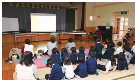
音楽療法士の活動を説明する様子