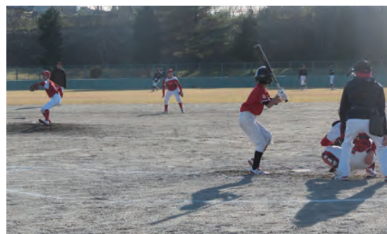
日々の練習の成果を発揮しました

試合は中山ジュニア野球スポーツ少年団がサヨナラ勝ちを収めるなど、大いに盛り上がりました。閉会式では「友好の賞状」が授与され、友好を深めました。