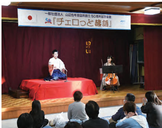
軽快な語り口と綺麗な音色が響きます