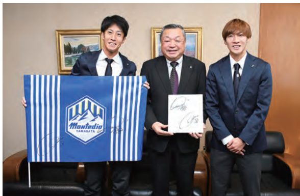
南選手（左）と土居選手（右）からサインが贈られました