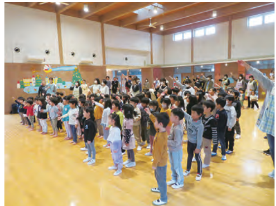
歌に合わせて踊る園児たち（なかやま保育園）