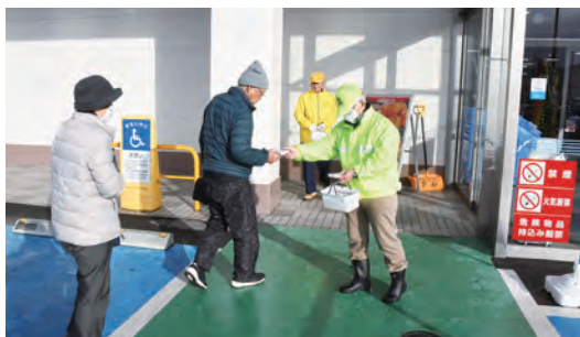
ティッシュを配り啓発する参加者

積雪やアイスバーンなどの冬型の交通事故防止のため、12月12日にヤマザワ中山店で啓発活動が行われました。活動には交通安全協会長崎支部、豊田支部や警友会、豊田駐在所、事務局が参加し、買い物客に対して、雪道はスリップするためより安全な運転を心がけることや、忘年会などで飲酒運転をしないよう呼びかけました。