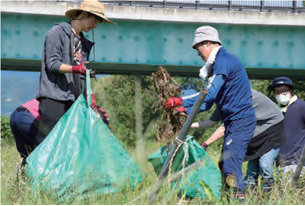
最上川中山緑地復旧事業作業の様子