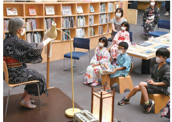
怖い怖い怪談会の始まりです

また、日が暮れると、昔語りの会とほんわ館ファンによる「怪談会」が始まり、巧みな話芸で子どもたちを楽しませました。