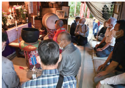
厳かな雰囲気で行われました