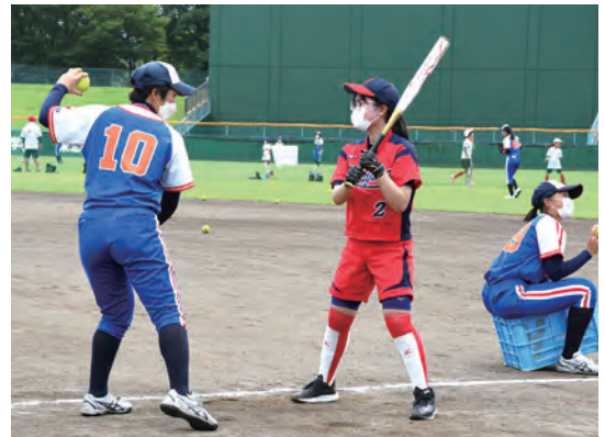
貴重な時間を過ごしました

選手と参加者たちは、ウォーミングアップで体をほぐした後、ポジションごとにわかれて練習を始めました。バッティング練習では、構え方や重心の移動の仕方などを丁寧に教えてもらいました。また、ピッチング練習では、ボールがうまくコントロールできずに悩んでいる参加者に、選手が腕の振りや手首の使い方など一つずつ確認しながらアドバイスをしていました。