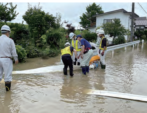
県の可搬式排水ポンプを利用した 排水作業（小塩地区）

8月3日から4日にかけての置賜地方を中心とした大雨により最上川が増水し、町内では農作物等の被害や道路の冠水被害などが発生しました。被害を受けられた皆さまに心よりお見舞い申し上げます。