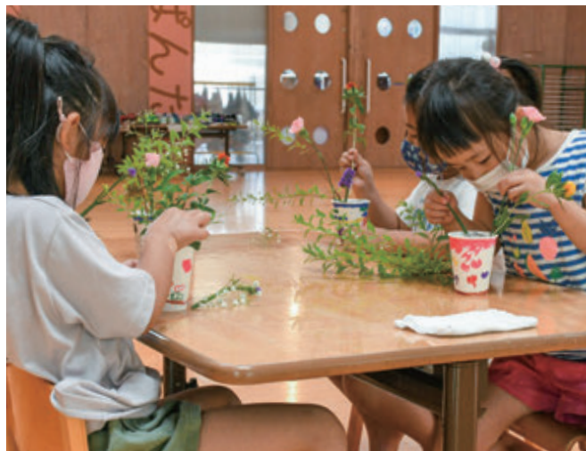
お花が折れないように慎重に生ける園児たち

園児たちは完成した作品を見て「すごくきれい」 「この白とピンクのお花かわいい」と声を上げ、初 めてのいけばな体験を楽しんでいるようでした。