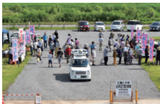
ピンク色ののぼり旗が目印です

軽トラの荷台では、今がおいしい夏野菜や夏の定番かき氷など様々な商品が販売され、子どもから大人まで楽しめる市場になりました。当日は開始30分ほどで売り切れる店舗もあり、去年に引き続き賑わいを見せました。