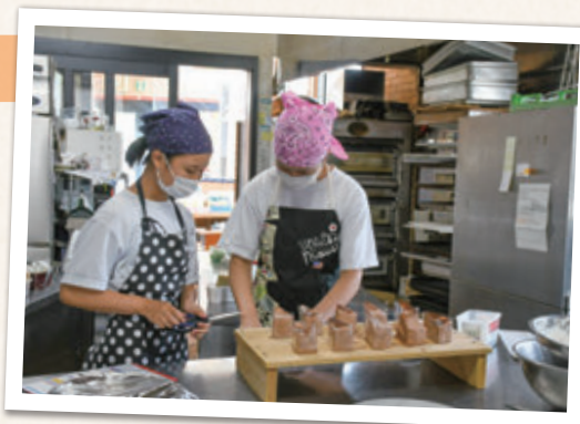
慎重に慎重に ケーキのラッピング

自分たちが一生懸命作ったお菓子が売れたとき、とてもやりがいを感じました。お客さんを待たせないように素早く行動して、挨拶やお礼を欠かさないように心がけました。1日中立ち仕事で大変だけれど、とても楽しかったです。