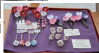
小物も販売しました→