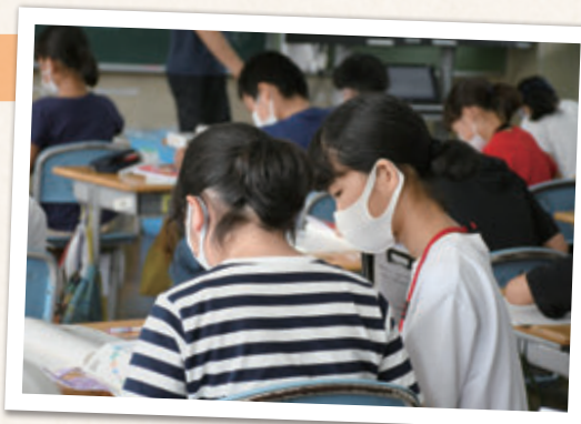
辞書を使って調べてみよう

児童たちはとても元気で積極的に話しかけてくれるので、思ったより体力が必要でした。一緒に遊んだり、わからない質問に答えたり、いろいろなことに対応する力を身につけられました。特に、児童同士のトラブルがあったときの対応はすごく大変だと思いました。