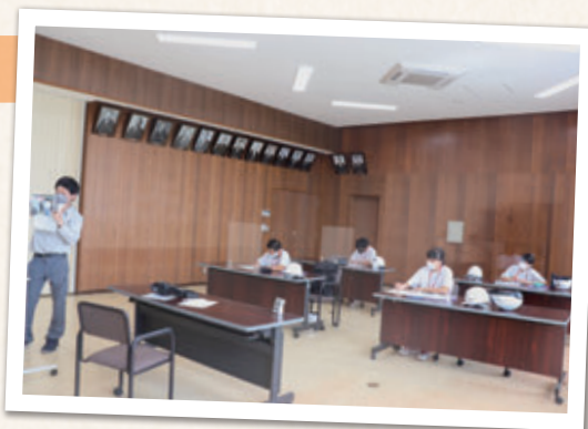
水道料金の計算に挑戦

水道料金の計算方法を教えてもらいました。自分たちが普段使っている水道について詳しく知ることができてよかったです。また、今まで下水道はトイレの水のことだと思っていたけれど、本当は家庭から出る全ての水のことだと初めて知りました。