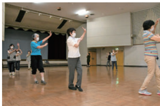
輪になって踊った中山音頭

戸田会長は、「まずは中山音頭を楽しんでほしいです。少しずつ覚えていってもらって、最後は女性まつりでお披露目したいと考えています。中山町の民謡なので、後世に伝えていきたいです」と話しました。練習会は今後も月1回の頻度で開催される予定です。