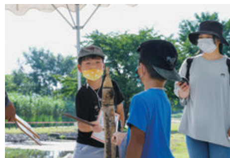
「がんばれ!」「まけるな!」

また、受付場所からせせらぎ公園までの道には、かぶくんや、すもものしずくちゃんに関する問題が掲示され、親子で謎解きを楽しみながら歩きました。