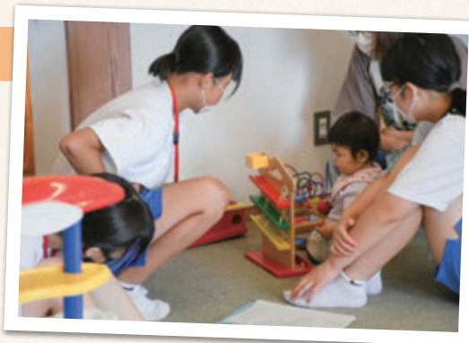
一緒におもちゃで遊んだよ

初日に七夕のイベントに参加したり、段ボールをアレンジしてボックスを作ったりしました。自分たちの作ったものを使ってもらえて嬉しかったです。子育て支援センターにはたくさんの赤ちゃんが来るけれど、こまめにおもちゃを消毒したり、新型コロナ対策をされていて大変だなと思いました。