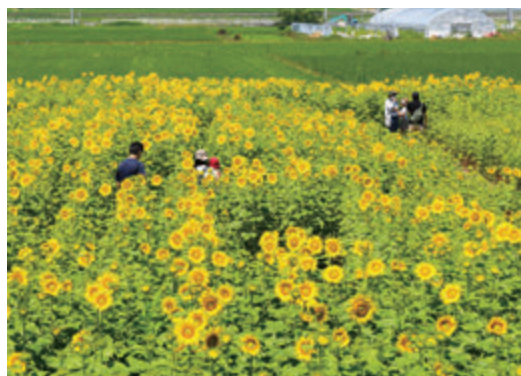
18日 天気もよく ひまわりは満開に