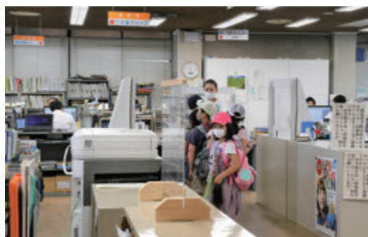
役場庁舎2階を見学する児童たち