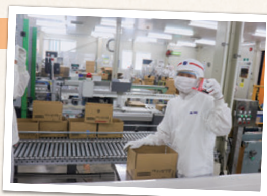
カメラに気づいてにっこり笑顔

ずっと立ちながらの作業だったので大変でした。社員の方々が黙々と手を動かしていたので、中学校の黙働清掃で見習っていきたいと思いました。今日はあんみつやゼリーを詰めました。お客さんの手元に届いたらおいしく食べてもらいたいです。