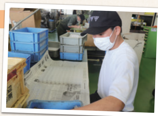
小さいナットも丁寧にチェック

お客さんに最高品質の部品を届けるために、1つ1つの部品をしっかりと確認しないといけないので、忍耐力が必要だと思いました。集中して同じ作業を繰り返すのは大変で、普段からこの仕事をしている社員さんはすごいと思いました。