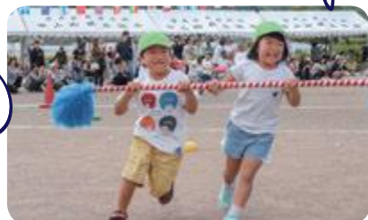
元気に駆けるちびっこ台風の目