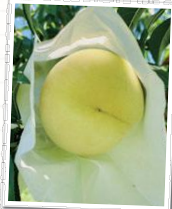
さめ細やかな美肌美尻

まだ陽に当たっていないカバー外したての黄色い桃も見せていただいたのですが、あまりの美肌&美尻にうっとり…。