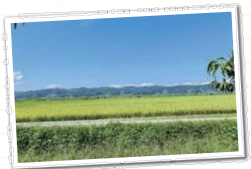
振り返るとまた別の景色が