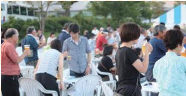
ビールを片手に乾杯！