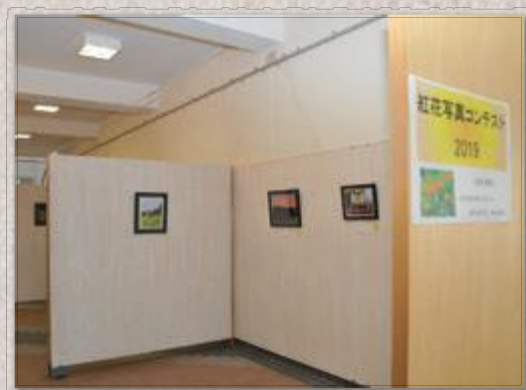
ほんわ館に展示された作品たち