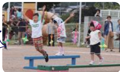
忍者になりきって大ジャンプ