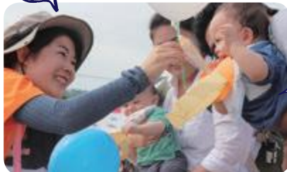
風船をもらって にっこり笑顔