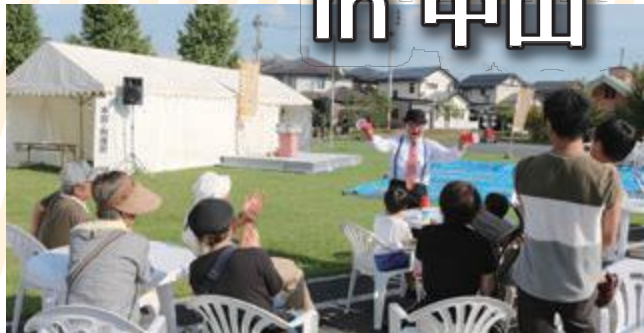
目の前でパフォーマンスを披露！

9月7日にひまわり温泉ゆ・ら・ら前交流広場で第3回オクトーバーフェストin中山が開催されました。暑い日差しのなか始まったオクトーバーフェストには町内外およそ1,200人が参加しました。今年は海外ビール8種類と国内ビールのほか月山ビールと天童ブルワリーが登場。火照った体に染み渡る冷たいビールと、おいしいおつまみにお客様は大満足のご様子。子ども向けアトラクションやステージパフォーマンスも行われ、子どもも大人も盛り上がる秋のイベントとなりました。