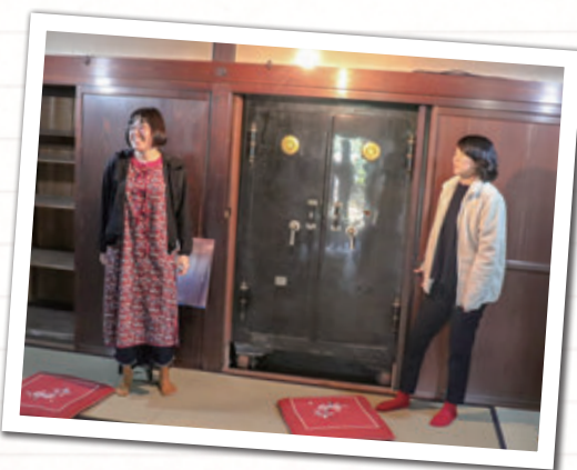
(写真右) 柏倉家住宅の中にある私たちの「発見」を発表させていただきました