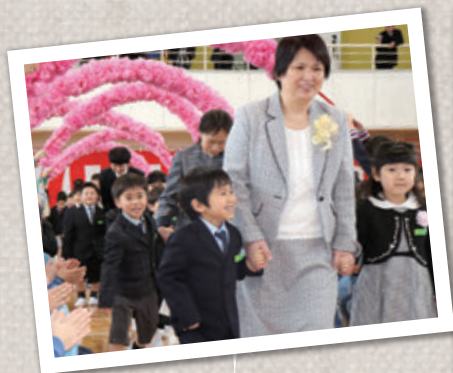
【長崎小学校】拍手で迎えられて入場（写真上）した新1年生56名（写真右）

「平成」と「令和」の時代をつなぐ小さな子どもたちには、未来への希望と可能性が限りなくあります。地域の皆さんで温かく見守っていききたいですね。