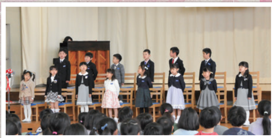
【豊田小学校】新1年生15名が式で歌を披露し（写真左）、在校生から歓迎の花束をもらいました（写真下）