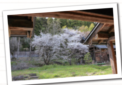
(写真左) 桜の花がほんのり綺麗に咲いています

4月20日に、私たちが開催した「地域おこし協力隊活動報告会」には、想像していた以上にたくさんのお客様に来ていただきありがとうございました。少しでも私たちの活動が伝えられたらいいなと思っています。