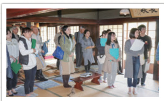
来てくださった方々、熱心にお話を聴いてくださり、ありがとうございました

皆さんこんにちは。すっかり春めいて、岡の山々にも春の彩りが見られるようになりました。