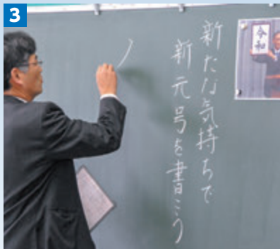
2,3 それぞれの授業の様子