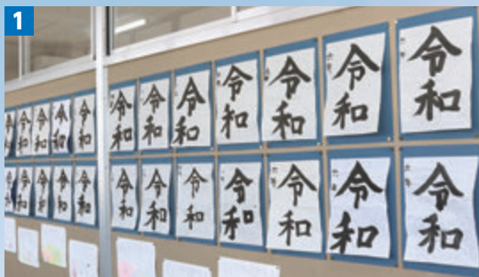
1 作品が早速展示されました

5月1日、新天皇即位に伴い、元号が「平成」から「令和」に改められました。それに合わせ、長崎・豊田両小学校の6年生が、書写の時間に新元号となった「令和」の文字を練習しました。また、令和の時代を担っていく子どもたちも大切なことを思っているのか、「自分の将来の希望」「新しい元号の時代に思うこと」など、自分の描く将来のことについて自由に話していただきましたのでご紹介します。