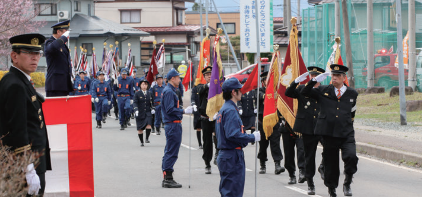
分列行進では力強く整然とした姿を披露し、来賓や沿道で見守る町民に防火・防災へ向けた決意を示しました