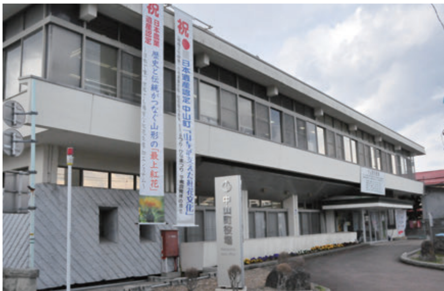
役場庁舎に懸垂幕を掲げ、先の「日本遺産認定」に続く、「日本農業遺産認定」の栄誉をPRしています

町では、県や関係市町村と連携しながら、紅花の新規生産者への技術指導や地域における紅花文化の伝承等の支援を行うとともに観光誘客や地域活性化等に活用していくこととしています。