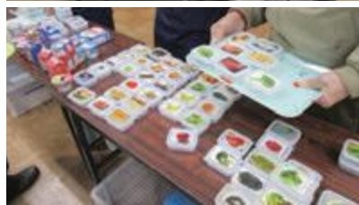
大勢の参加者が集まりました。 模型を使ってゲーム感覚で学びました