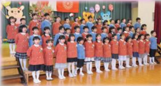
3月22日 ながさき幼稚園