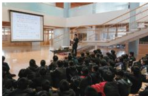
自分の家族が認知症になったらなどを考えながら真剣に聞き入っていました

中山中では防災学習に力を入れており、認知症について知ることは避難所運営の際などに役立てることができるということで、今回の講座の実施となったものです。