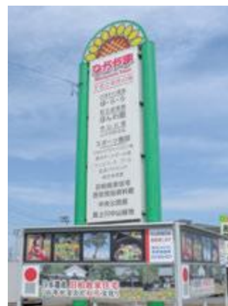
ひまわりが目印の さわやかなデザイン

これまでの看板が老朽化していたため、デザインを新たに作り替えたもので、グリーン色の2本のポールにはさまれたクリーム色の板面に町内の主要施設が紹介され、トップには町の花であるひまわりが描かれています。看板の下部は、入替可能な広告掲載部分となっており、時期に合わせたイベントなどの広告を見ていただけるようになっています。また、夜になるとライトアップされ、遠くからも浮き立って見えるような設計になっています。