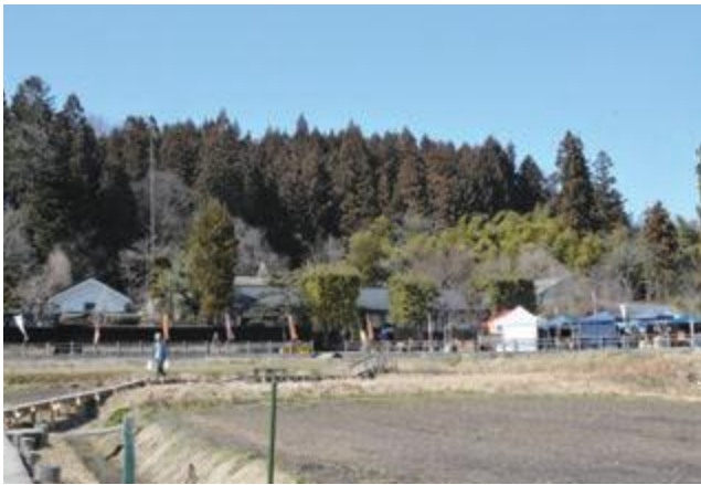
来年度から一般公開予定の旧柏倉家住宅