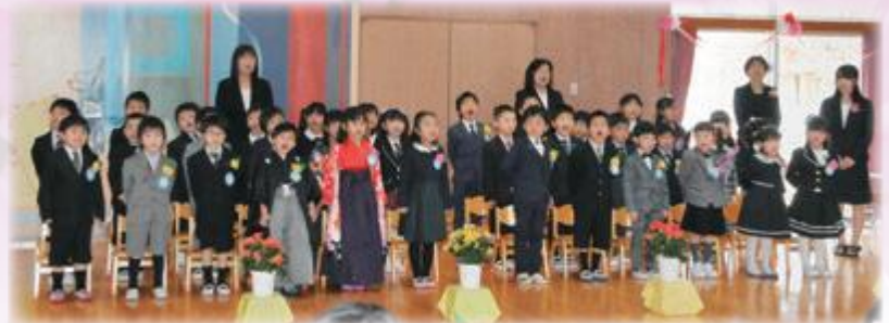
3月26日 なかやま保育園