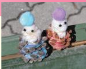
にぎわった黒塀マルシェ (写真右) と、マルシェの ワークショップでの手作り おひな様 (写真上)