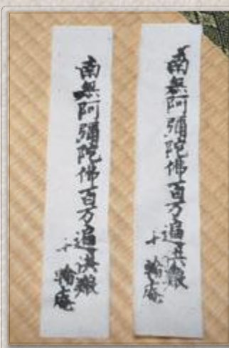
(写真左) 早朝、男性が刷る十輪庵のお札