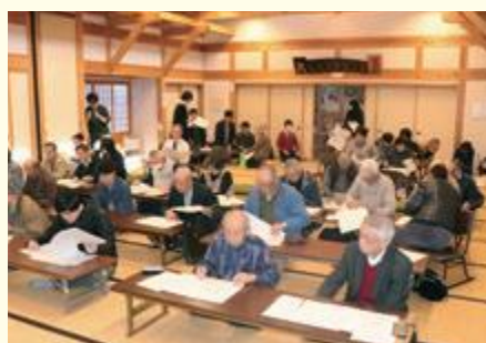
山形大学岩田ゼミの研究発表