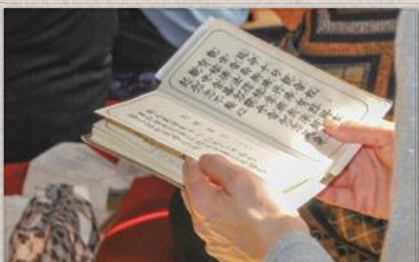
(写真左下) 代々受け継がれている地区の行事ということで、先輩に教えられながら、ご詠歌や般若心経などを唱える姿がみられました