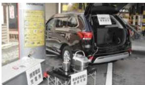
テレビの視聴などができる電動車両