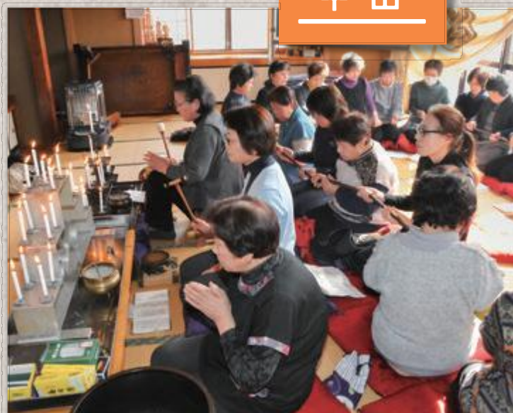
(写真上) 念仏を唱えながら数珠回しをする下川地区の女性たち

今年は3月3日に行われ、男性は早朝からお札を刷り、女性たちは「南無阿弥陀仏」を唱えながら数珠回しをしました。下川地区の方々は、「昔ながらの地区の行事は少しずつ短縮されたりしながらも、大切に守っていかなくてはならないと思う」と話していました。