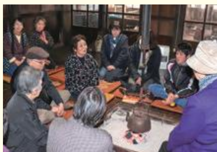
暖かい囲炉裏を囲んで昔語りを聞く