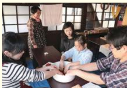
「どんな模様になるかな」紅花染め体験