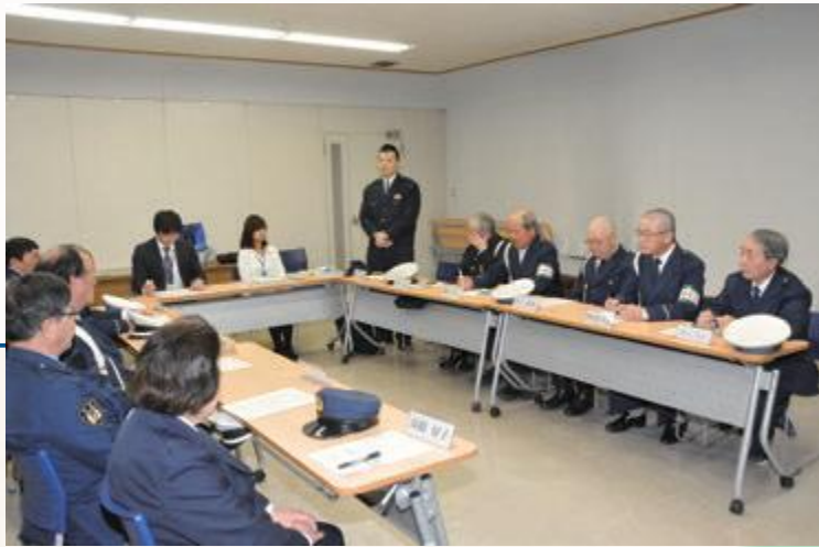
子どもたちの安全を守るため、話し合う

3月1日には、中央公民館を会場に「交通指導員会議」が開催されました。いつもはそれぞれの立哨場所で子どもたちを指導している交通指導員の皆さんが集まり、活動報告を行いました。