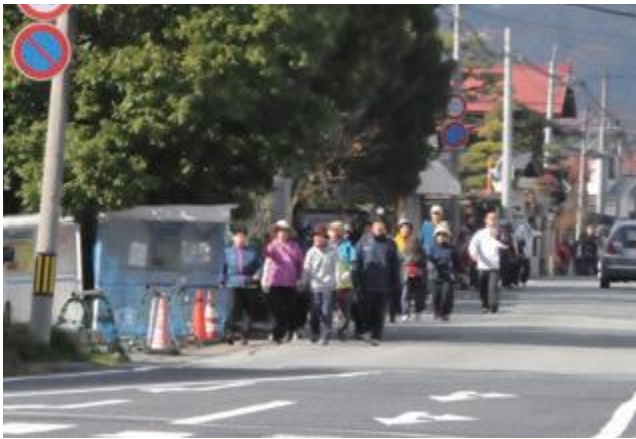
歩いて元気なまちづくりを推進