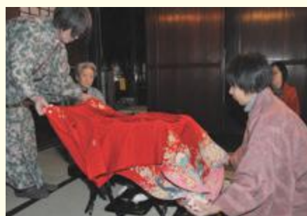
着物にお香を焚きしめる「伏籠」の実演