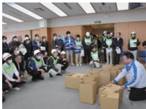
県外の施設などからも多くの参加者が訪れた避難訓練