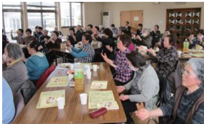
身振り手振りをしながら、大きな声を出して歌うと、心が晴れ渡ります。あなたも参加してみませんか

このグループは昨年開催された担い手養成講座（町と社協の共催）で「歌・楽・茶」としてイベントを開催した際、受講者から、「またやってほしい」との要望が多く寄せられたため立ち上がったボランティア団体です。楽しい体操をはさみながら、リクエスト曲全12曲を全員で歌いました。平成31年度は中山町数カ所で開催予定です。