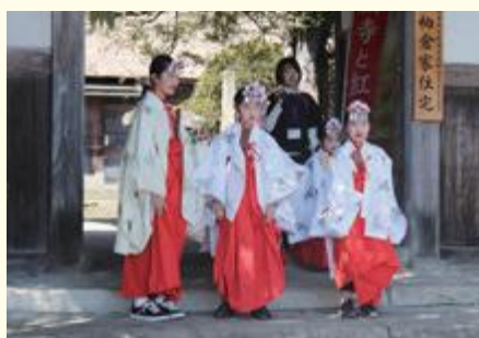
人気のあった巫女舞の子どもたち