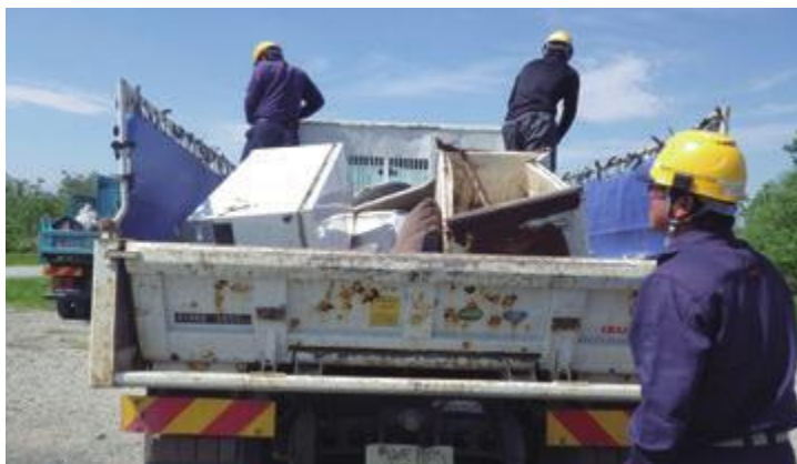
古い家電などが集められ、その量の多さに驚かされた