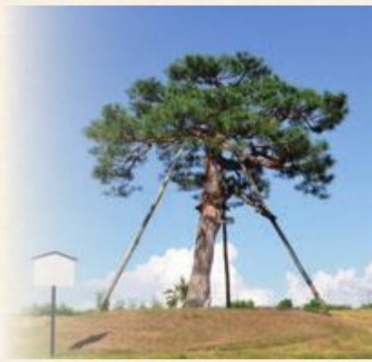
芋煮会発祥の地の象徴「鍋掛松」

「最上紅花」と呼ばれた村山地域の紅花は、「米の百倍・金の十倍」と言われた高級品でした。その交易は莫大な富を生み、そしてその産地には蔵屋敷が建てられました。