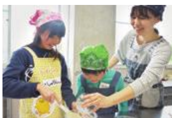
絵本の世界の料理教室。ドーナツの生地はこねすぎないのがコツだそうです