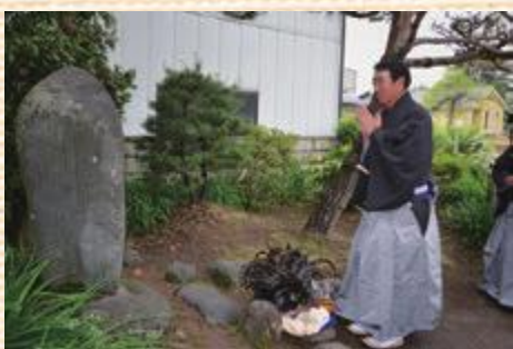
今も受け継がれる土橋地区の獅子踊り。奉納の前に、祈りを捧げます