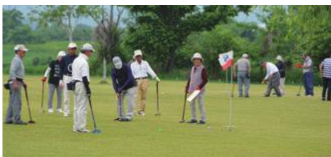
人気のあるひまわりグラウンド・ゴルフ場でのプレーの様子(チャレンジデー)

回答 現在開錠時間は、年間を通して原則8時30分、6月から8月までの土曜日・日曜