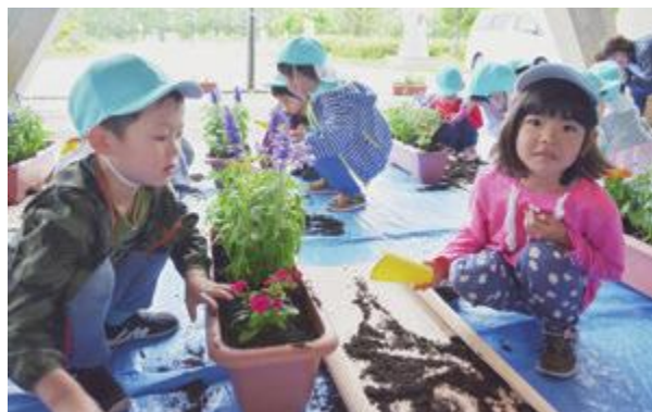
私たちが植えた花をスタジアムに見にきてね

園児たちが植栽したプランターは、スタジアム入口付近のロータリーに飾られていますので、ぜひご覧ください。