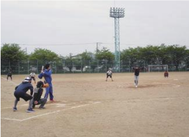
日頃の運動不足を解消する、はつらつとしたプレーがみられました