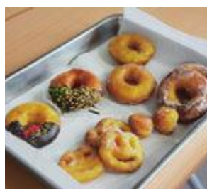
さまざまな形のドーナツができました

難しかったけれど、プロの先生に教えていただき、とても良い経験になりました」と話し、お菓子作りを楽しんでいます。