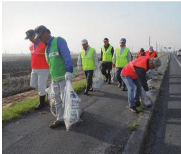
早朝からの作業を行う参加者の皆さん

集めたごみの量は軽トラック1台分くらいになり、参加者たちは「道路にごみを捨てないという意識を徹底してもらいたい」と話していました。