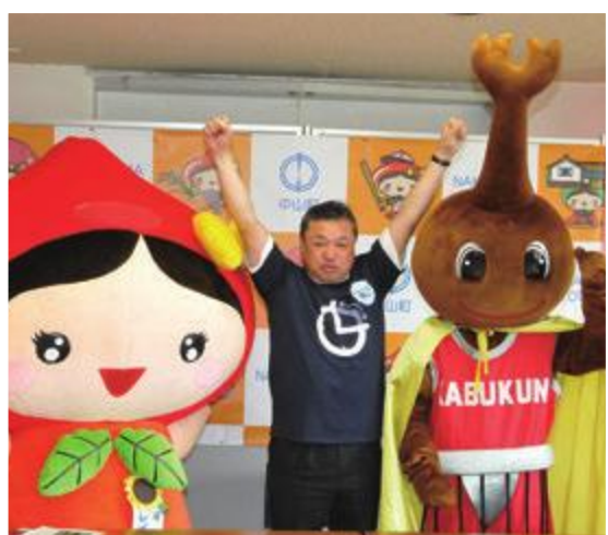
大会前のエール交換で士気を上げる町長

豊かな自然と歴史文化あふれる中山町。「スポーツとフルーツ 伸びゆく町 なかやま」のキャッチフレーズに違わぬ成績を取められるか?!