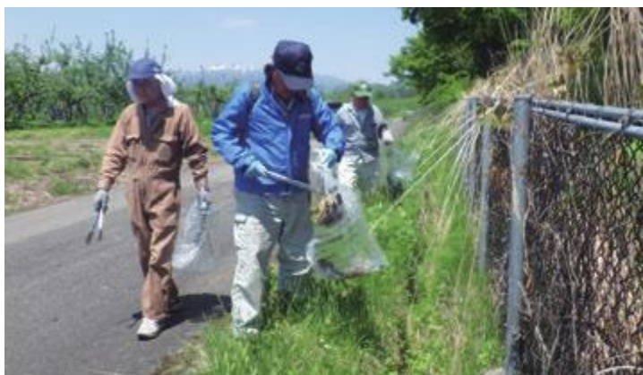
広い範囲を手分けして回収作業にあたった

5月11日、町内の最上川・須川の河川敷等と高速道路の側道で、町衛生組合連合会と環境保全監視員が合同で、不法投棄パトロールとごみの回収作業を行いました。