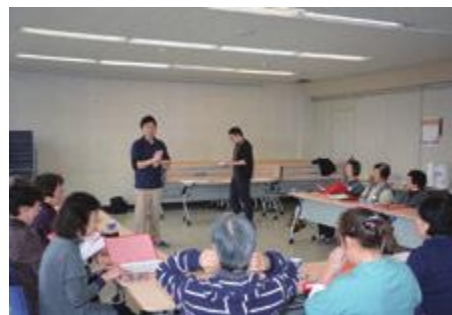
町が行う高齢者向けの事業の様子

うちに多くの人が集まり、問診票を地面において順番を取っていました。山形県成人病検査センターでの健診時のように、早めに玄関を開けるという対応はできないでしょうか。