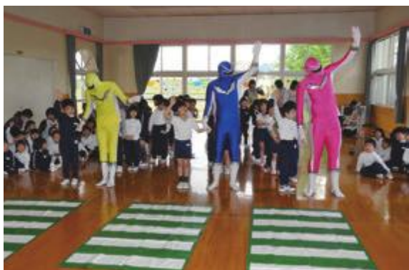
かっこいい信号レンジャーと、交通安全を学びました

町の交通安全専門指導員と横断歩道を渡る時の約束をおさらいした後、佐川急便の社員の方が赤・青・黄色の衣装に身を包んで交通安全信号レンジャーに扮して登場すると、園児たちは大興奮。いつにも増して元気よく手をあげて、横断歩道を渡る練習を行いました。