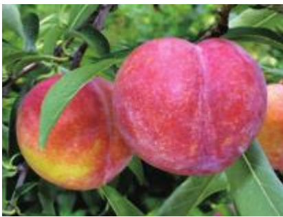
町の特産品のすもも（秋姫）