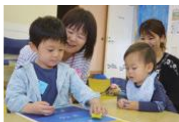
カエルのジャンプ競争。ほんわ館ファンの方が遠くへ跳ばすコツを教えてくださいました