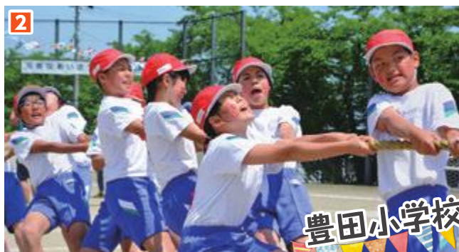
1 「徒競走」。それぞれ自己ベストを目指し頑張りました 2 「綱引き」。全員で力を合わせて引っ張りました