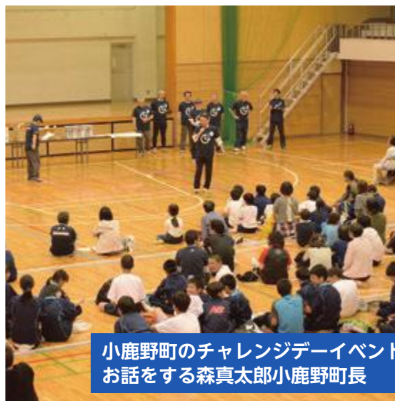
小鹿野町のチャレンジデーイベントでお話をする森真太郎小鹿野町長

今年の対象相手「小鹿野町」は、埼玉県北西部に位置しています。秩父多摩甲斐国立公園、県立西秩父自然公園などの自然公園や、日本百名山の「両神山」をはじめ、日本の滝百選の「丸神の滝」、平成の名水百選の「毘沙門水」など、豊かな自然環境に恵まれた町です。