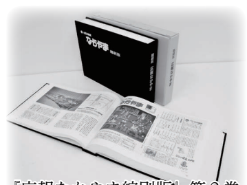
『広報なかやま縮刷版』第2巻