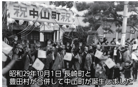
昭和29年10月1日 長崎町と豊田村が合併して中山町が誕生しました

※当日は同会場で『健康と福祉のフェスティバル』を同時開催します。詳しくは9月15日号折り込みチラシをご覧ください。