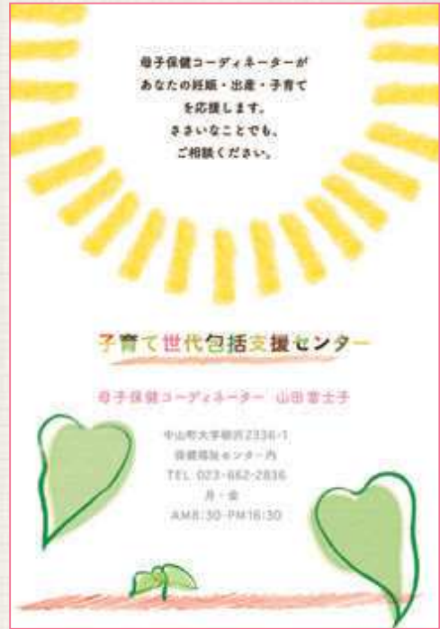
このカードを母子手帳に添えて、差し上げています

「初めての妊娠・出産で不安です」「つわりがひどくてどうしよう」「赤ちゃんが母乳をうまく飲んでくれない」「赤ちゃんが泣いてばかりで、ママも泣きたいです」「家に赤ちゃんを二人きり。ほかのママはどうしてる?」こんな悩みはありませんか。少しでも心を軽くできるよう、ご相談くださいね。