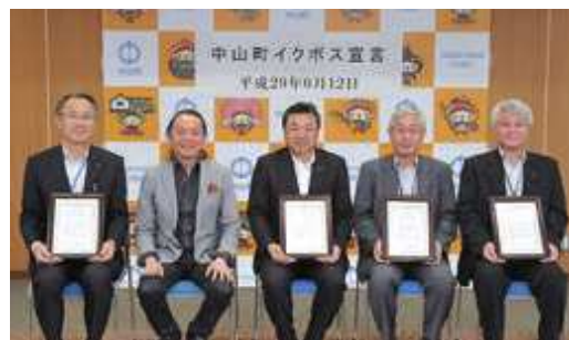
中山町として「イクボス宣言」を実施した