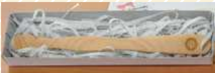
木のぬくもりを感じる離乳食用のスプーンを差し上げています