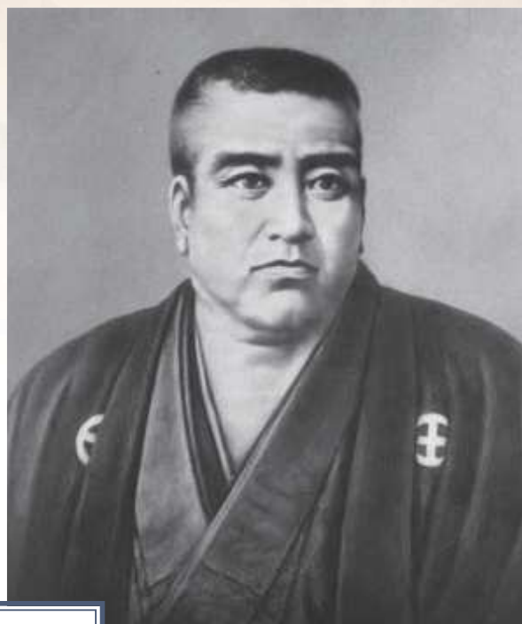
数少ない西郷隆盛の肖像

隆盛は4人兄弟の長男で、3男が従道です。従道の読み方は「つぐみち」という読み方が一般的ですが、「じゅうどう」と読むのが正しいという話もあるようです。