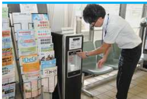
パンフレットスペースの脇に設置してあります

中山町消費生活相談窓口(住民税務課住民G内) 電話662-2593 役場①番窓口 月～金曜日(祝日除く) 午前8時30分～正午/午後1時～4時