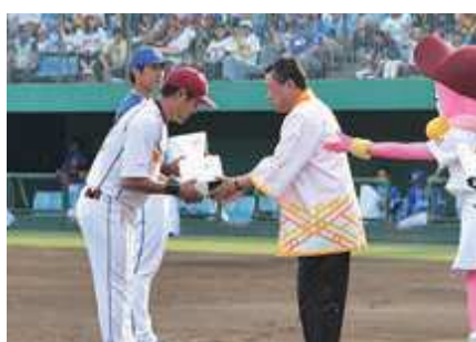
両チームにすももワインをプレゼント (楽天対DeNA戦)

いずれの試合も、迫力あるプロのプレーを見ようと訪れた大勢の野球ファンでスタジアムが埋め尽くされました。