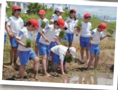
(写真上) 7月7日の青田巡回に集まった石っころ会の会員の方々。