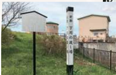
現在の防災センターの南側に建てられた史跡の看板