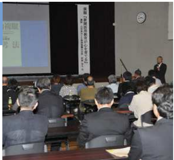
新聞教育の重要性に多くの関係者が耳を傾けた

※Newspaper in Educationの略。学校で新聞を教材として活用すること。