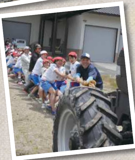
(写真左) いろんな馬力のトラクターと5年生全員での綱引き。どっちの力が強いかな。