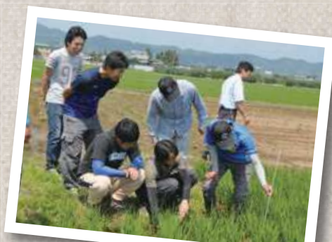
今年の稲の生育状況を確認する