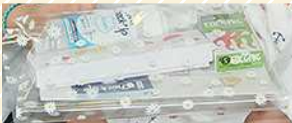
歯が生えた時に使うフッ素や赤ちゃん用フロスなども入っています