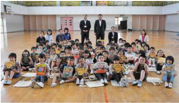
「早く読みたいな」もらった本を手に、笑顔で記念写真（長崎小）