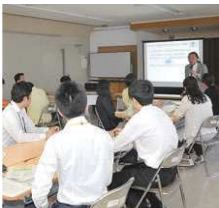
町内事業所の担当者が熱心に話を聞いていた

「イクボス」とは、職場で共に働くスタッフのワーク・ライフ・バランス（仕事と生活の調和）を考え、部下の仕事上の経験や、人生を応援しながら、会社としての組織の業績の結果を出し、なおかつ、自らも仕事と私生活を楽しむ上司のことを言います。