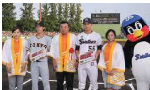
旬のサクランボで選手を激励 (ヤクルト対巨人戦)

また、町から、特産のすももワイン（楽天対DeNA戦）やサクランボ（ヤクルト対巨人戦）がそれぞれのチームに手渡され、「スポーツとフルーツの町」をアピールしながら、選手たちを激励しました。