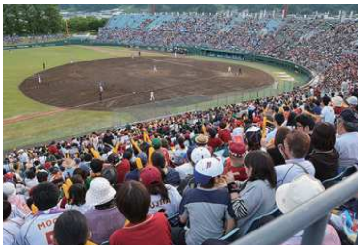
多くの観客で埋め尽くされた楽天対DeNA戦