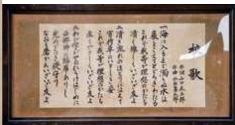
歴史民俗資料館に保存されている長崎小学校の昔のバルコニーと、今も歌い継がれている校歌

三わが学びやのひらけはじめに 西郷卿の臨席ありし 光のたまたみ礎守り なほも磨かんいざいざ友よ