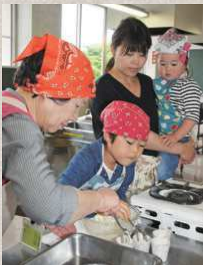
ほんわ館ファンの方にお手伝いしてもらい、お母さんと妹と一緒にカップケーキを作りました

ほんわ館は、ここでのイベントや事業のサポートをする「ほんわ館ファン」というボランティアの方々から支えられています。現在、ほんわ館ファンの人数は22人。一緒に活動してみたいと思う方は、いつでも登録できますので、お気軽にほんわ館にお問い合わせください。