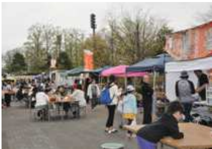
面白いものでいっぱい ホームランマルシェ