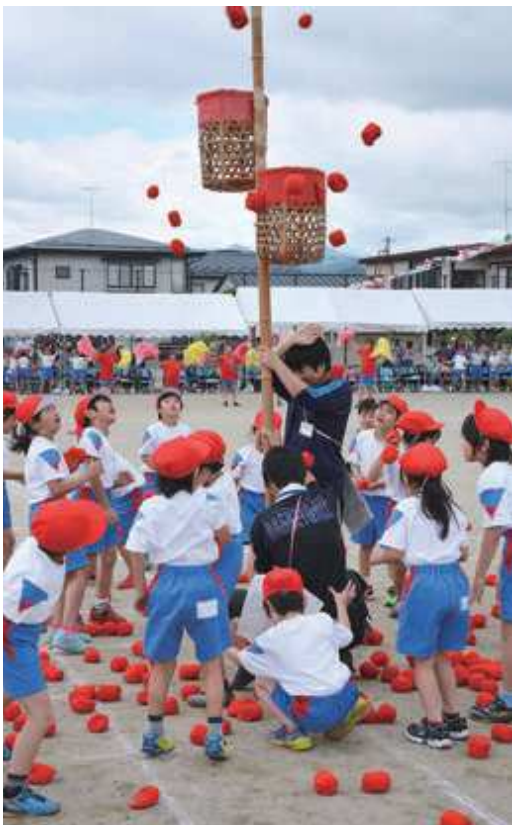
「うまく入るかな」1年生の玉入れ競技（長崎小）

保護者や地域の方々の熱い声援を受けながら、徒競走や綱引き、玉入れなどのさまざまな競技が行われ、校庭には児童の元気な声が響きました。児童たちは、競技や応援合戦に全力を尽くし、両校とも熱の入った運動会となりました。