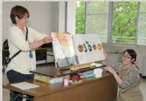
大きな絵本に出てくるお菓子を作ろう！学生さんのボランティアの方々