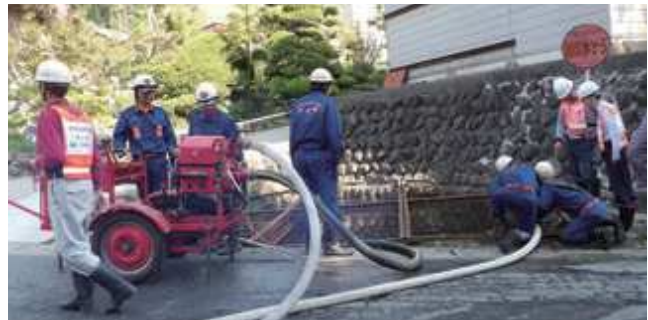
水を汲み上げ、本番さながらの実践的な防火訓練が行われた