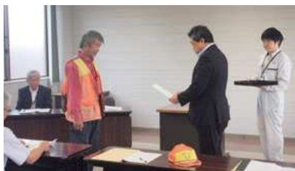
鳥獣被害対策実施隊ひとりひとりに委嘱状が交付された

ようとされる方に対する、免許取得費用への補助金交付事業を実施する予定です。 また、5月26日には、「中山町鳥獣被害対策実施隊」の委嘱状交付式が行われました。これは、農作物を鳥獣被害から守るため、新たに結成されたもので、鳥獣被害防止計画に基づき、農地や