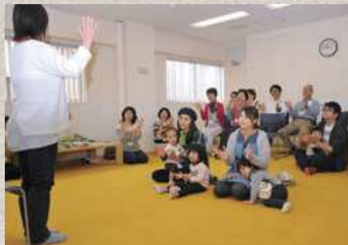
スペシャルお話会で、ほんわ館ファンと参加者で楽しい手遊び

ほんわ館には、子ども向けの絵本だけでなく、さまざまな分野の書籍55,608冊を蔵書しています。本を通した豊かな時間をほんわ館で過ごしてみませんか。