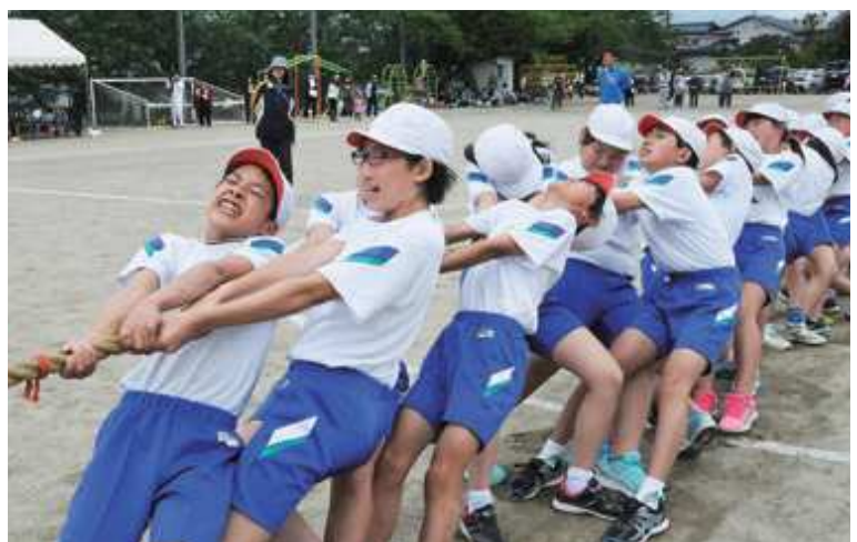
「絶対に負けられない戦い」と盛り上がった全校綱引き（豊田小）