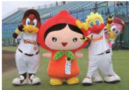
しずくちゃんと楽天の キャラクターが勢揃い