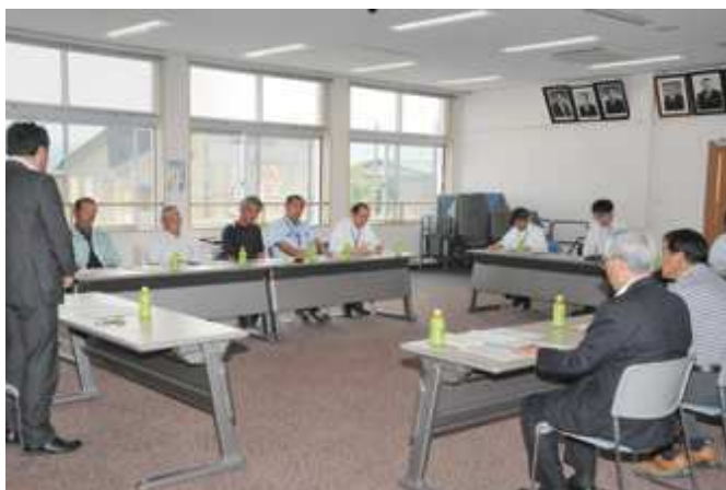
活発な意見が出された協議会の様子