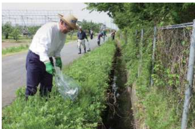
この日も多くの廃棄物やごみが回収された