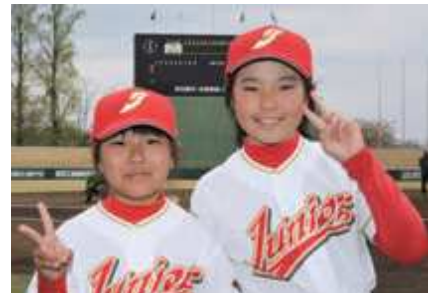
「ちょっと緊張したけど楽しかった」と介添役の2人