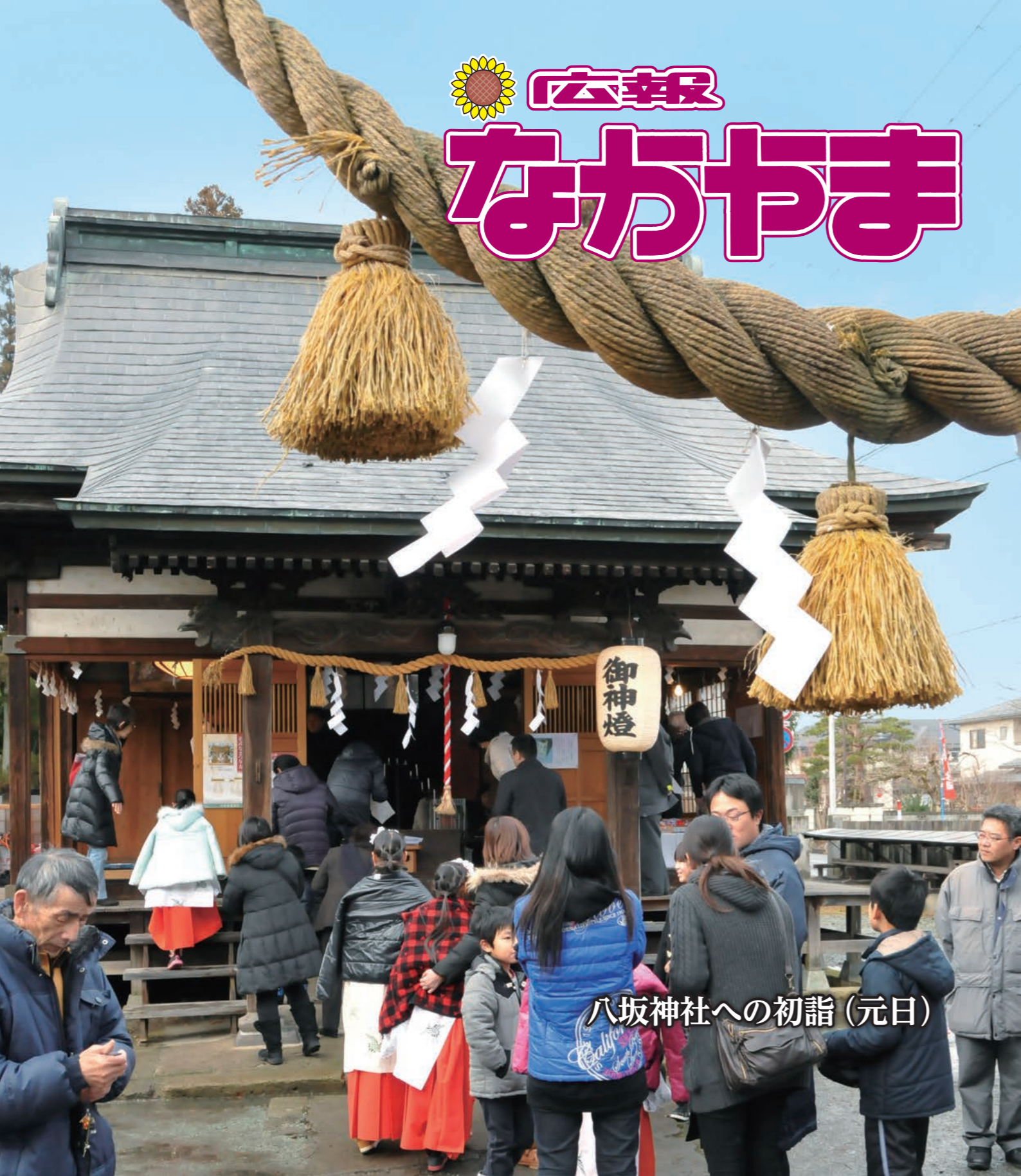
八坂神社への初詣(元日)