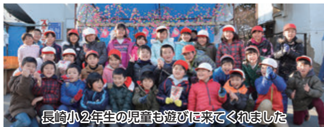
長崎小2年生の児童も遊びに来てくれました

1月12日に豊田小学校、20日に長崎小学校で「租税教室」が行われ、6年生の児童が税金について学びました。この教室は、次代を担う児童に、町や国の財政を支える税の意義や役割を正しく理解してもらうことを目的としたもので、2年前から実施しています。