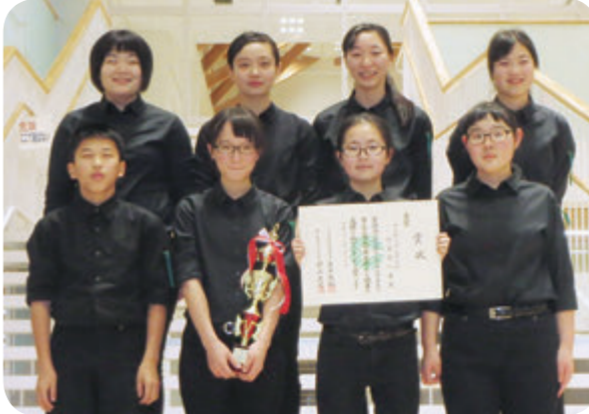
→中山中学校吹奏楽部木管三重奏(写真左) 真右、同打楽器八重奏(写真右)

1月16日と17日の2日間、酒田市民会館希望ホールで「全日本アンサンブルコンテスト第39回山形県大会」が開催され、中学校の部に中山中学校吹奏楽部から「木管三重奏」、「打楽器八重奏」の2組が出場しました。会場の張り詰めた雰囲気の中、これまでの練習の成果を發揮して息の合った演奏を披露し、両組とも金賞受賞という快挙を成し遂げました。また、木管三重奏は県代表（1位）にも選ばれ、2月に秋田で開催される東北大会への出場が決定しました。