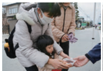
あんこ餅の振舞いは「甘すぎず美味しい」と好評でした