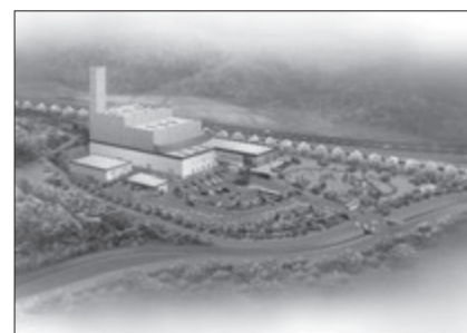
完成予想イメージパース

組合では、「信頼」「安心」「親近感」の施設コンセプトのもと、2つのエネルギー回収施設の良好な建設・運営に向けて今後もなお一層努力してまいりますので、皆さまのご理解とご協力をお願いします。 本事業の進捗状況については、随時当組合のホームページ( http://www.yamagata-koiki.or.jp/ )に掲載してまいります。