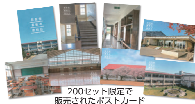
200セット限定で販売されたポストカード