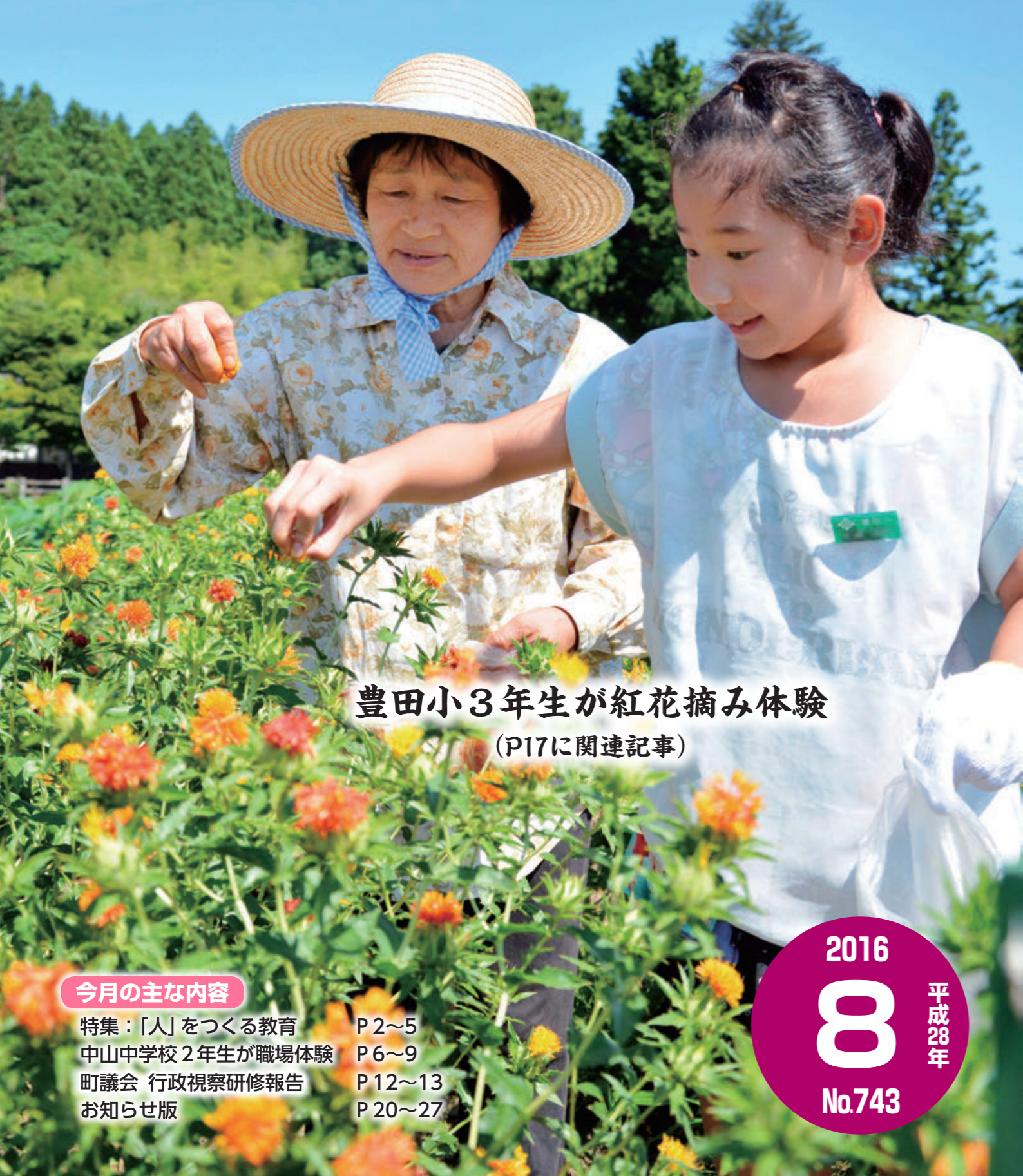
豊田小3年生が紅花摘み体験 (P17に関連記事)