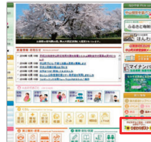
手順① トップページ右側の、赤で囲まれているバナーをクリック