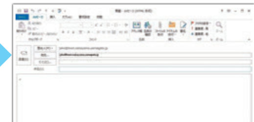
手順③・④ 件名、本文に内容とご連絡先を入力し、送信

リックします。 ③すると、メール送信ページに切り替わるので、件名や本文にご意見や提案の内容を入力してください。また、忘れずにご連絡先も入力してください。 ④入力完了したら、最後に「送信」と町宛にメールが送られます。 こちらも、ひまわりポストと同様の方法で、提案していただく方に回答を返信することになります。なお、開封できない場合があるため、ファイル等の添付はご遠慮ください。