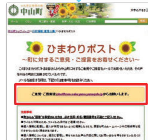
手順② メールアドレスの上にカーソルを合わせ、もう一度クリック

「まちづくりには関心があるけれど、普段仕事をしていたり、ひまわりポストに投かんするのが難しい」という方は、インターネットメールを利用して提案してみませんか。手順は簡単です。 ①まず、町の公式ホームページにアクセスします。表示されるページの右の列に「ひまわりポスト」というバナーがありますのでそこをクリックしてください。 ②画面が展開して、ページ中ごろに町宛のメールアドレスが表示されますので、メールアドレスの上にカーソルを合わせ、もう一度ク