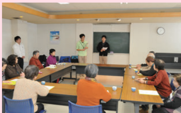
「脳力アップ教室」脳トレや軽体操、認知症に関する講話を通じて脳力アップを図っています。