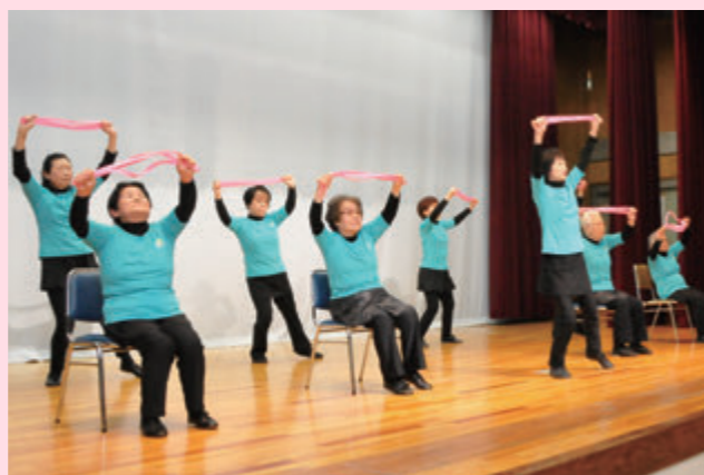
3 B体操中山教室の皆さん