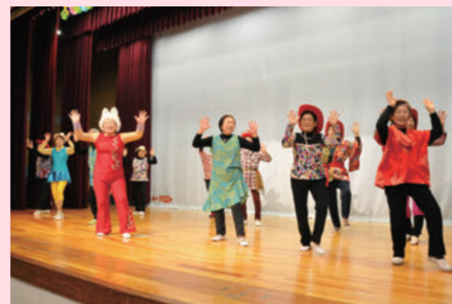
さわやかひまわり会の「長生きサンバ」