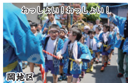
わっしょい！わっしょい！