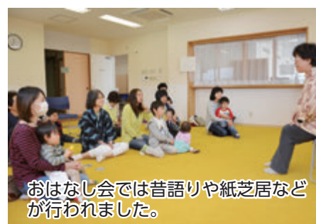
おはなし会では昔語りや紙芝居などが行われました。