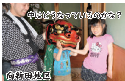
中はどうなっているのかな？