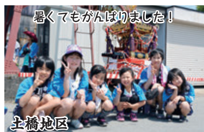
暑くてがんばりました！