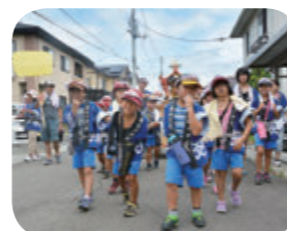
↑元気いっぱいの子どもみこし(桜町)