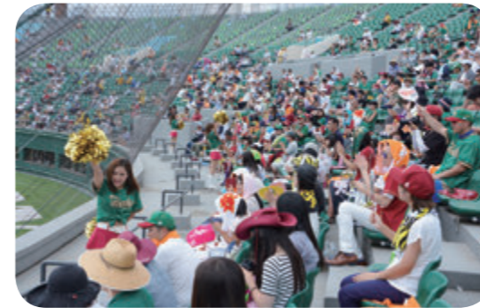
多くの方が観戦を楽しみました