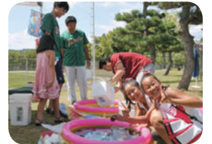
すもものつかみ取り 楽天応援団の少女たちも笑顔で体験