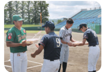
記念品の贈呈 中山ベースボールクラブより