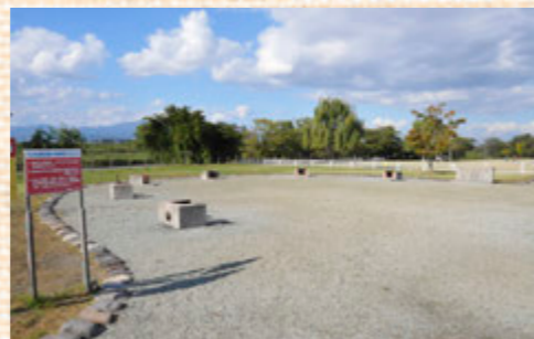
ひまわりグラウンド・ゴルフ場西側にある芋煮広場もぜひご利用ください