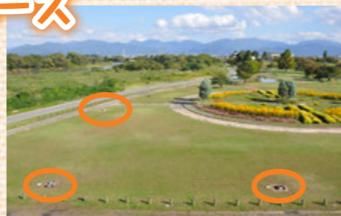
せせらぎ公園内に6カ所設置されました

いつでも使用できますので、ぜひご利用ください（前日の場所とりなどのご遠慮ください。またごみは持ち帰りましょう）。