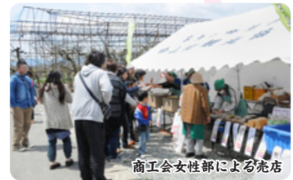
商工会女性部による売店

山形県天然記念物指定を受けた樹齢750年のエドヒガン「お達磨の桜」を中心としたお達磨の桜公園で、4月15日から5月6日まで、桜まつりが開催されました。 中山町観光協会が主催するこの桜まつりは、町内外からの観光客を呼び込むため、ホームページ上でお達磨の桜や開花状況を毎日紹介したほか、公園までの誘導看板を設置。訪れた人には商工会女性部による団子、玉こんにゃく、飲み物などの販売や今年から公園内のガイドマップを配布しました。 さらに、期間中はお達磨の桜公園管理組合による桜のライトアップ、4年ぶりとなる達磨寺田植踊りの披露や戸山流山形支部木口道場の皆さんによる真剣斬り演武の披露など、様々なイベントも開催されました。 今年は4月に入ってから気温が上がらず例年よりも遅い開花となりましたが、開花がゴールデンウィークまで続いたおかげで、休日には多くの花見客が訪れ、歴史ある美しい大樹の桜を心ゆくまで楽しんでいました。