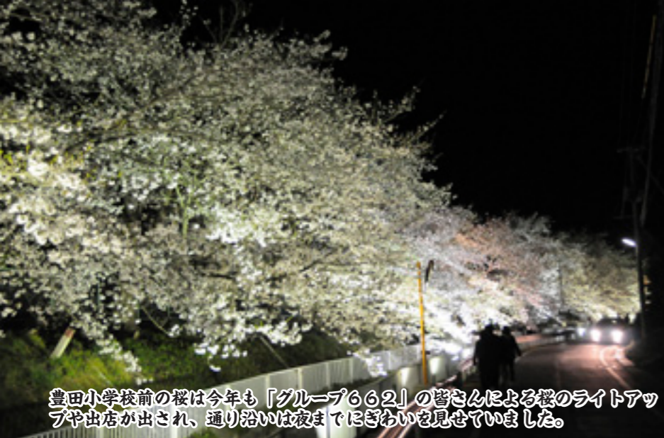
豊田小学校前の桜は今年も「グループ662」の皆さんによる桜のライトアップや出店が出され、通り沿いは夜までにはぎわいを見せていました。

山形県天然記念物指定を受けた樹齢750年のエドヒガン「お達磨の桜」を中心としたお達磨の桜公園で、4月15日から5月6日まで、桜まつりが開催されました。 中山町観光協会が主催するこの桜まつりは、町内外からの観光客を呼び込むため、ホームページ上でお達磨の桜や開花状況を毎日紹介したほか、公園までの誘導看板を設置。訪れた人には商工会女性部による団子、玉こんにゃく、飲み物などの販売や今年から公園内のガイドマップを配布しました。 さらに、期間中はお達磨の桜公園管理組合による桜のライトアップ、4年ぶりとなる達磨寺田植踊りの披露や戸山流山形支部木口道場の皆さんによる真剣斬り演武の披露など、様々なイベントも開催されました。 今年は4月に入ってから気温が上がらず例年よりも遅い開花となりましたが、開花がゴールデンウィークまで続いたおかげで、休日には多くの花見客が訪れ、歴史ある美しい大樹の桜を心ゆくまで楽しんでいました。