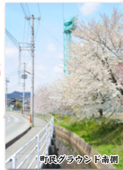
町民グラウンド南側