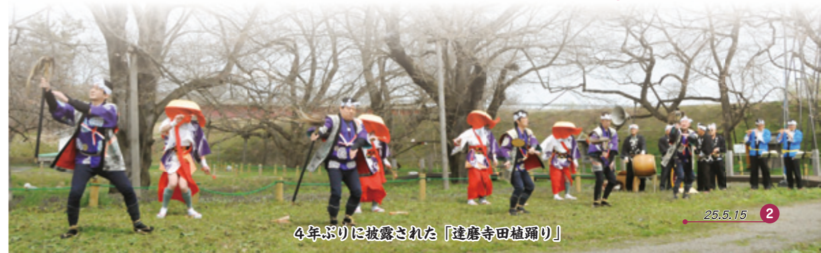
4年ぶりに披露された「達磨寺田植踊り」