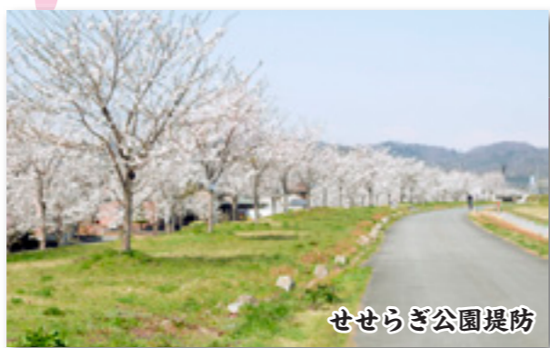
せせらぎ公園堤防