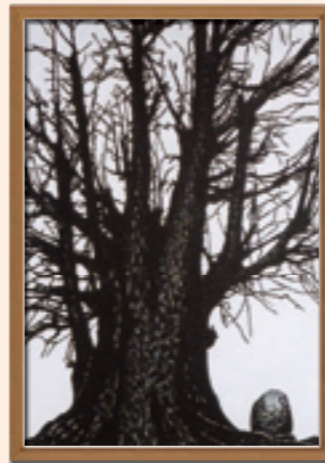
楯の大イチョウの拓版画

拓版画とは、彫った版木全体に和紙を貼り、全体をプレス機にかけ、凸部分にだけ墨をつけた後、和紙をはがして完成させる手法。通常のバレン刷りの7~8倍の時間がかかりますが、立体感を出すことができます。