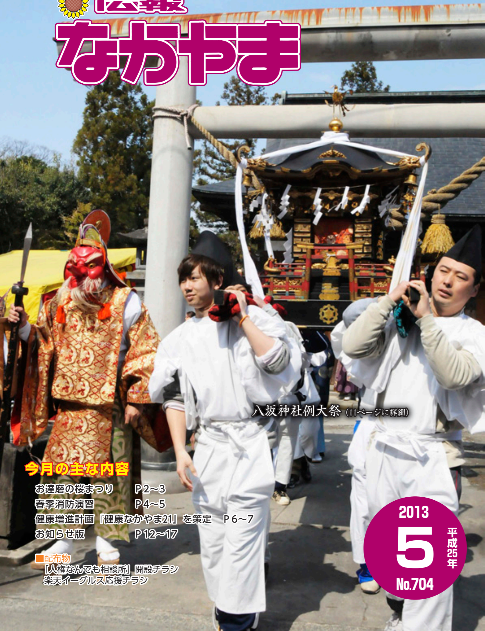
八坂神社例大祭 (11ページに詳細)