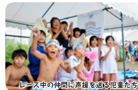
レース中の仲間に声援を送る児童たち