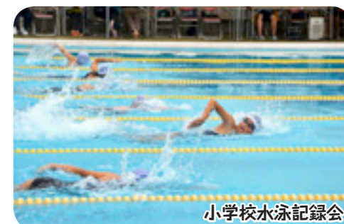
小学校水泳記録会

なかやま保育園では、7月3日にプール開きを行いました。子どもたちは、ピンクや黄色など色とりどりの水着を着用し、ビー玉拾いなどに挑戦し、夏ならではのプールあそびを思いっきり楽しんでいました。