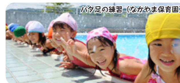
バク足の練習 (なかやま保育園)