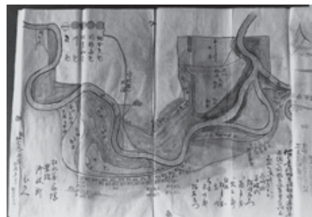
図一 嘉永7年畑荒地起返鏡絵図(最上川川筋) 上部は、血沼、右上二筋の最上川、須川合流点、落合、三軒屋

嘉永7年(1854)は、大早魃の年で、「図一畑荒地起返鏡絵図」によると小塩村の東で「へんぐり」の曲流を作ったあと、最上川はなおも蛇行しながら下川にいたっています。上川原から南の「古川」は、部分的に水溜りを残しながらも主要部は起返りが行われています。また、河道が安定していないため、新川筋の附近には荒地が広がっています。下川の先は、流路を北東にとって落合の北で須川を合わせています。合流の直前、河道は二俣になって、一つは三軒屋の南に蛇行しています。