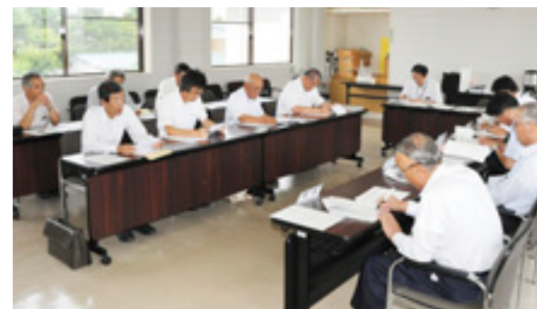
小塩地区要望会のようす