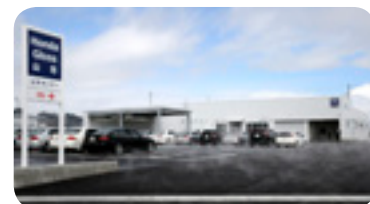
4月から営業を開始した「Honda Gloss山形」

なかやま西部工業団地の詳細は町ホームページ ( http://www.town.nakayama.yamagata.jp/sinchaku/seibukougyoudanti.html ) または土地開発公社 (TEL662-2115) まで。