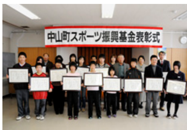
※写真には代理で受け取った方も含まれています。

中山町スポーツ振興基金表彰は平成23年度中に大会等で優秀な成績を収めた方や、スポーツの振興に大きく貢献された方に対し、その栄誉をたたえ表彰するものです。 3月18日には中央公民館で表彰式が行われ、次の1団体と県大会優勝者または東北大会・全国大会で優秀な成績を収めた方21人に殊勲賞が贈られました（敬称略）。 おめでとうございます。