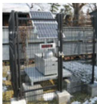
役場職員駐車場内

文部科学省は福島県内や隣県各地に130台の放射線測定器を設置し、測定結果をリアルタイムで文部科学省のホームページで公開しています。その測定器の一つが役場北西の職員駐車場内に設置されました。測定器は太陽光パネルとバッテリーを備え、万が一電源が供給できなくなった状況でも計測が可能。電光パネルに現在の放射線量を表示するとともに、10分ごとに測定結果をデータ送信します。