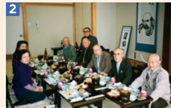
【1】昨年秋の芸文祭での作品展示の様子 【2】会食の様子。和気あいあいとした雰囲気です。