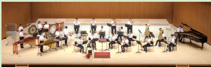
<やまぎん県民ホールでのリハーサル風景>

吹奏楽部が見事に県大会出場を果たしました。新型コロナ対策のため、練習形態や活動場所が制限されるなど、思うように活動ができない期間が続きましたが、今年度になり活動の幅が広がり、壮行式での選手入場や地区中総体での野球の応援など、心を込めた演奏で仲間を勇気づけてくれました。県大会での更なる活躍を期待しています。吹奏楽部の皆さんは、今月30日の中学生小編成の部に出場します。