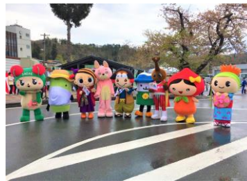
左沢駅での記念セレモニー

従来あった飲食店マップに中山町の見どころ等の情報を追加した「中山町飲食店＆見どころマップ」と、見やすい大きさに改良した日本語、英語、中国語の「芋煮会発祥の地リーフレット」の作製を行いました。