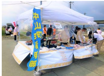
商工会青年部売店