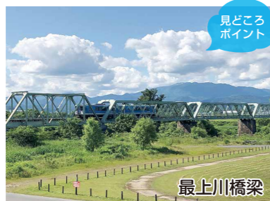
見どころポイント

最上川沿いの堤防から中原工業団地を通過し、町の中心地へ戻ってくるコース。堤防から望む山形盆地を囲む山々は新緑から紅葉まで季節感を強く感じられます。