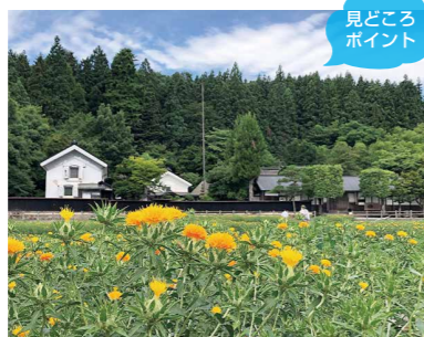
見どころポイント

中山町西部へ向かい、豊田地区北部を周回するコース。折り返し地点にある旧柏倉家住宅は、令和元年に国の重要文化財に指定されました。是非立ち寄りください。