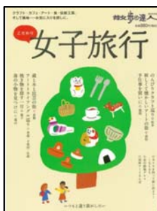
『こだわり女子旅行』