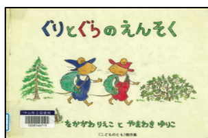
『ぐりとぐらのえんそく』