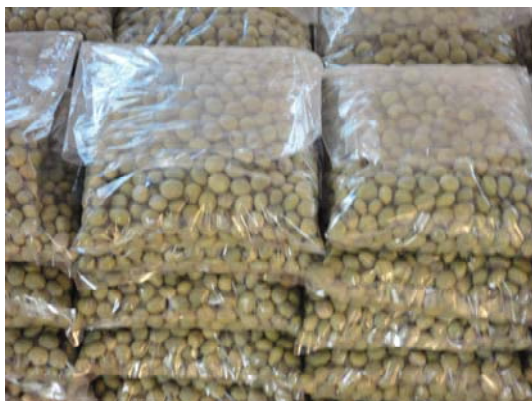
あおばた豆 (300 g・200 円)