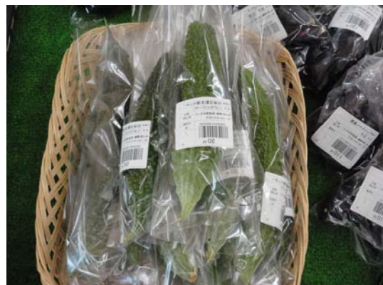
ゴーヤ (1 本・50 円)